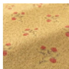
T0722002 Old gold