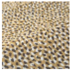
T0728003 Burnt gold