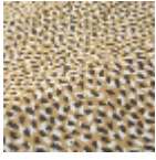
T0728003 Burnt gold