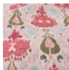
T0739002 Kenya red