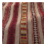
T0740001 Ogee red