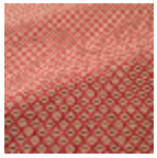
T0741001 Ogee red