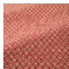
T0741001 Ogee red