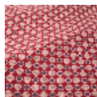
T0746001 Ogee red