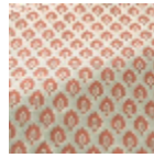
T0752004 ICE BLUE