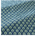
T0752003 Dark blue