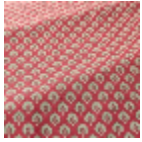
T0752001 Deep red