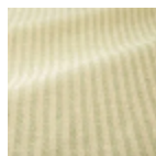
T0766001 Vaux celery