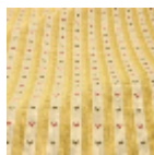
T0769002 Old gold