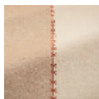
T0771002 Burnt orange