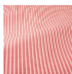
T0772002 Kenya red