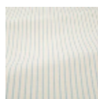
T0772001 Ice blue