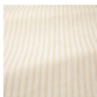
T0773002 Old gold