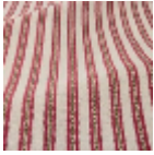
T0776003 Deep red