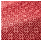
T0788002 Wild rose