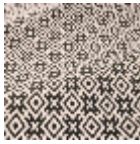
T0788003 Black & white