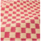
T0807001 Kenya red