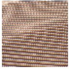
T0808001 Deep red