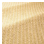
T0820001 Old gold