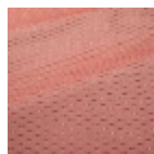
T0822001 New tomato